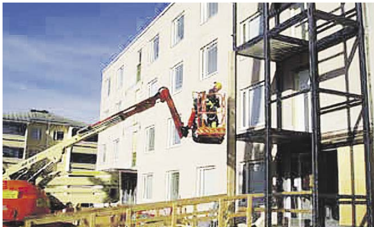
Ulkopuolisen hissikulun asennusta KOY Heinolan Kisakulmassa

Suomen heikohkosta taloustilanteesta huolimatta valtio tukee hissien asentamista edelleen vuonna 2016. Talousarvioesityksessä vuodelle 2016 korjaus- ja energia-avustusten määrärahat laskevat kuitenkin 25 miljoonaan euroon, jolloin uusien hissien rakentamisavustuksiin arvioidaan olevan käytössä noin 14 miljoonaa euroa. Avustuksen ehtojen mahdollisista muutoksista ei ole vielä tietoa, mutta ARA tiedottaa niistä viimeistään tammikuussa 2016. Lisätietoja avustustilanteesta on saatavissa ARAn kotisivuilta www.ara.fi .